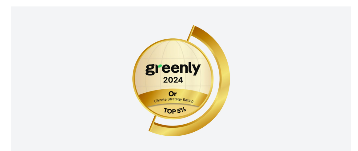
Un engagement fort RSE