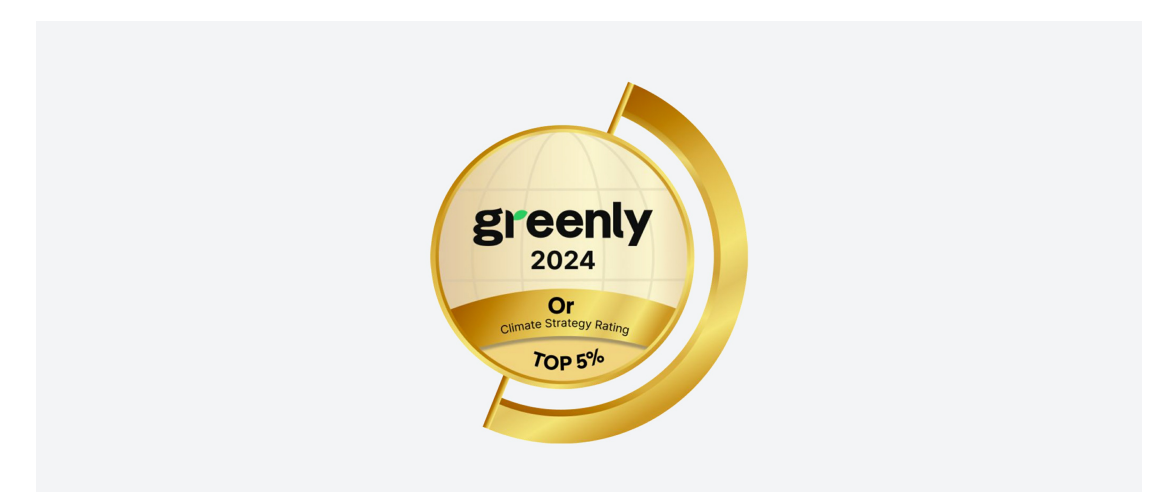
Un engagement fort RSE