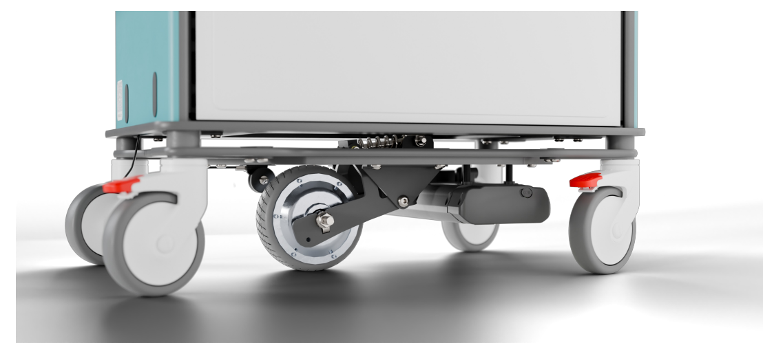
Motorisation avec la 5 e roue