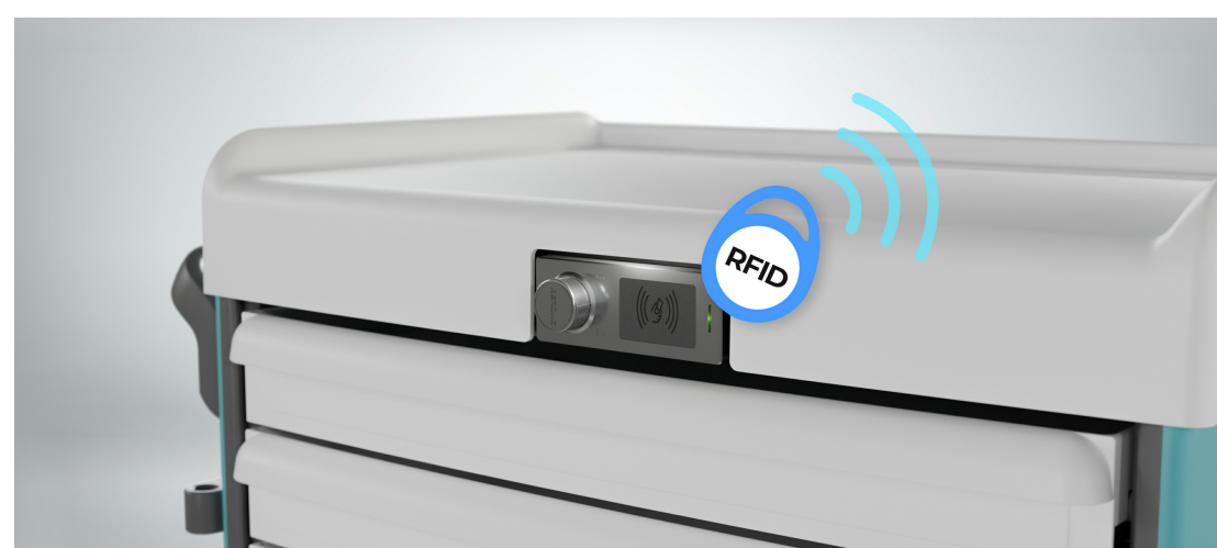
Sécuriser le stockage