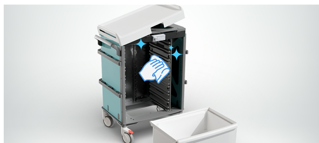
Faciliter le nettoyage