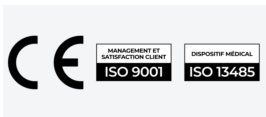
Un niveau de certification de premier plan