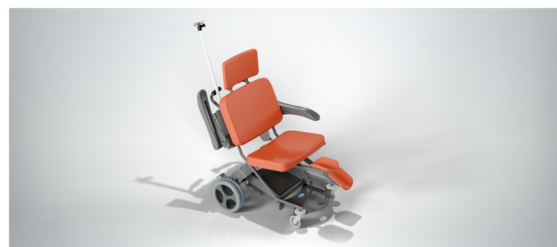
Optimiser les soins lors de la prise en charge