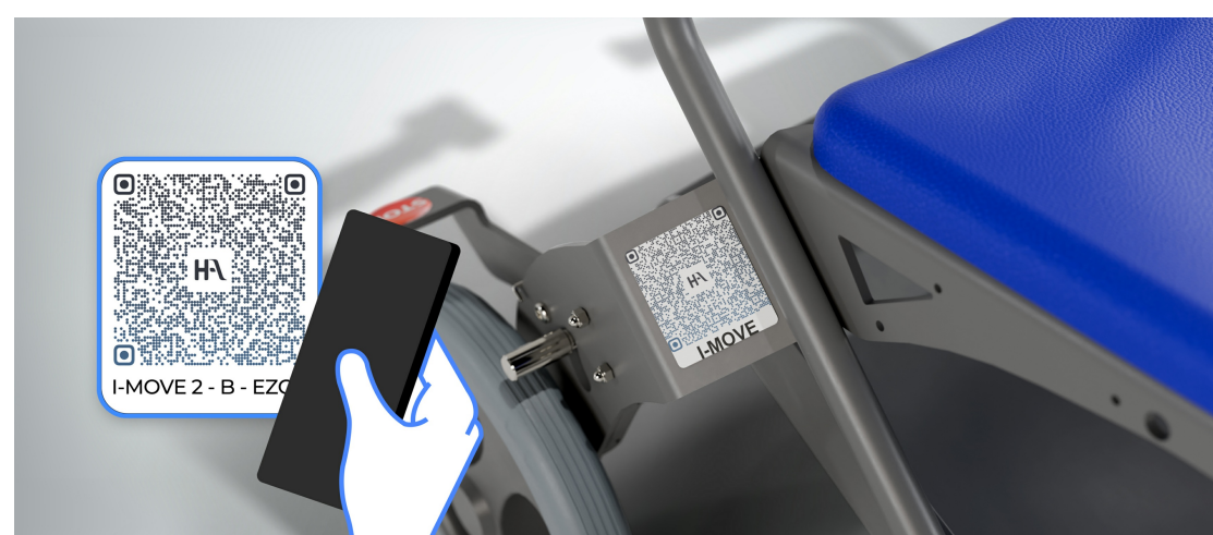
Transfert de patients de toutes morphologies