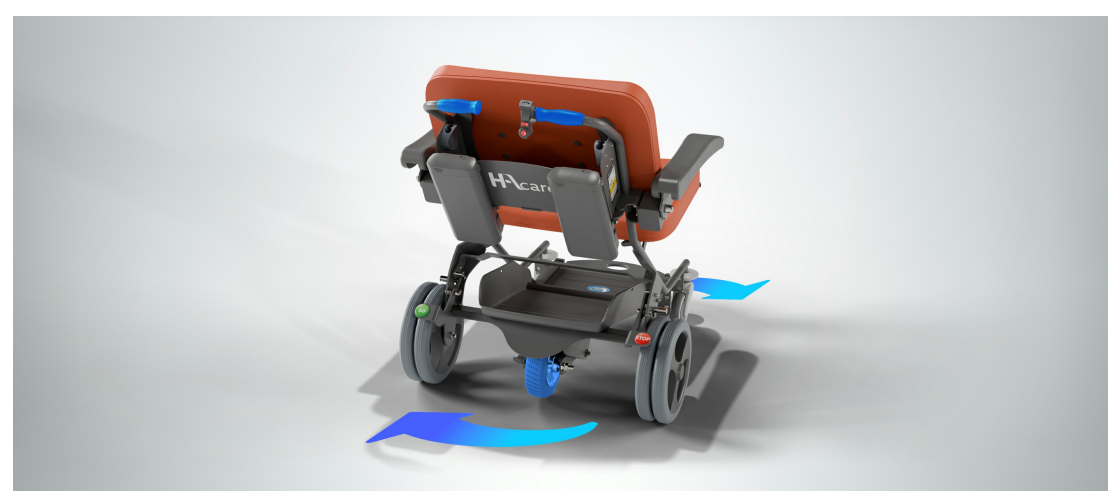
Lutter contre les TMS