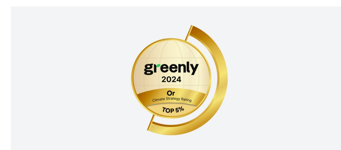
Un engagement fort RSE