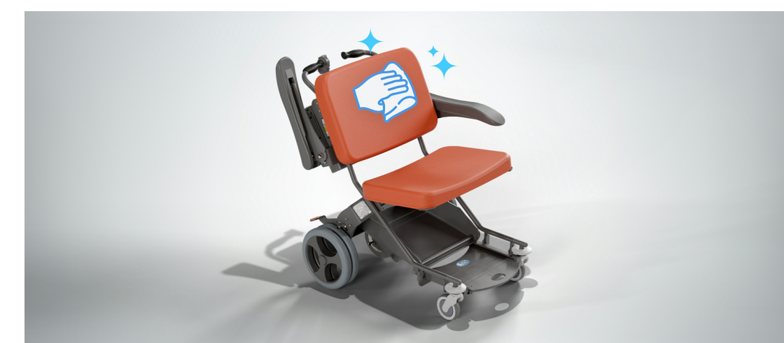
Faciliter le nettoyage