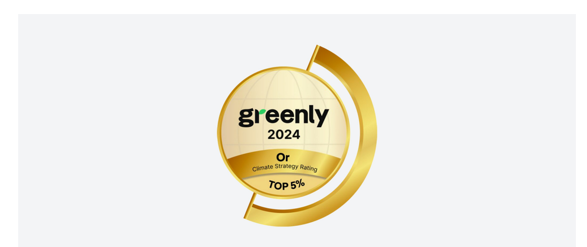
Un engagement fort RSE