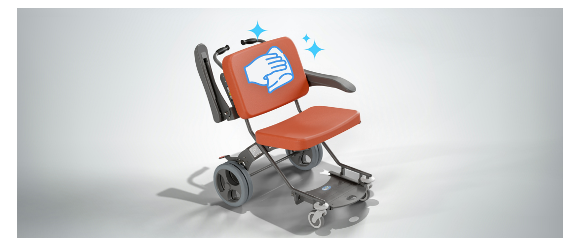
Faciliter le nettoyage