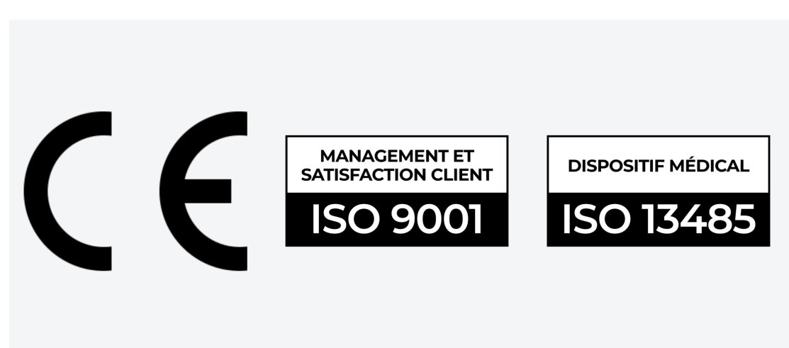
Un niveau de certification de premier plan