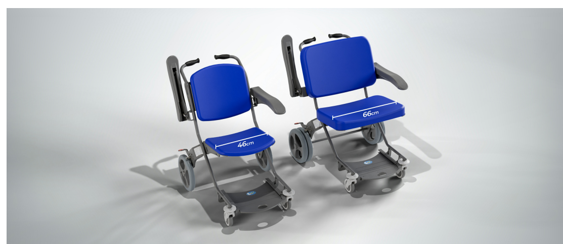
Transfert de patients de toutes morphologies