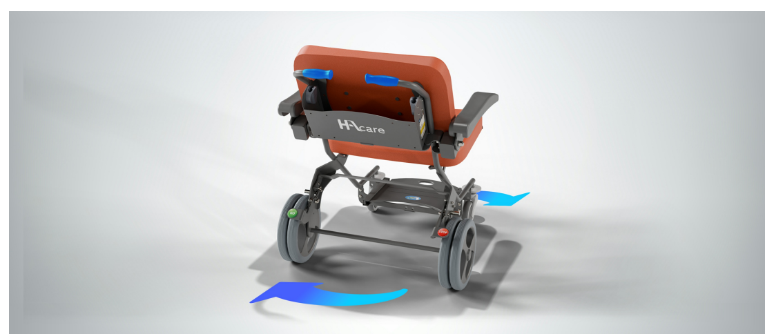
Lutter contre les TMS