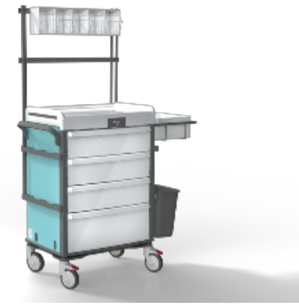
Chariots à plâtre