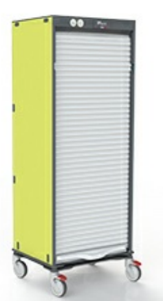
Armoires de stockage fermées