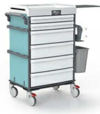
Chariots de soins