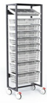
Armoires de stockage ouvertes