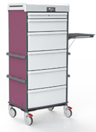
Armoires de nursing