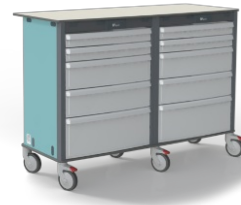
Plans de travail mobiles